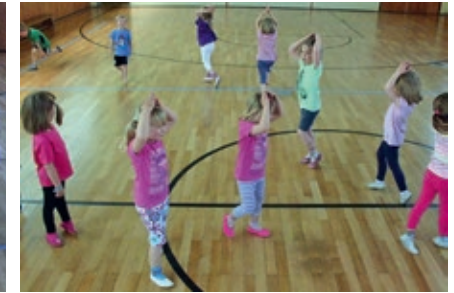
Hexen mit Hut