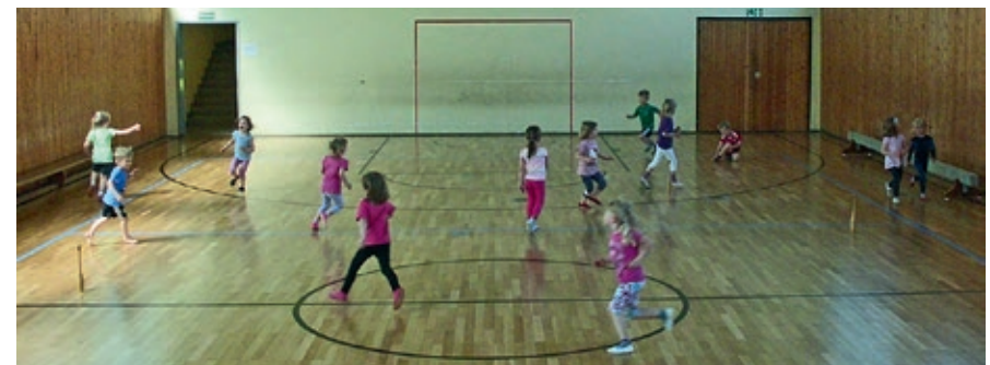
Ritter fangen die Prinzessinnen

Als nächstes gingen wir in den Schlossgarten und formten aus den Springseilen zuerst ein paar Blumen und Bäume, bevor die Ritter die Prinzessinnen fangen und ins Schloss sperren sollten. Als alle Prinzessinnen gefangen waren, durften diese natürlich auch noch die Ritter fangen. Als letzte Aufgabe balancierten wir