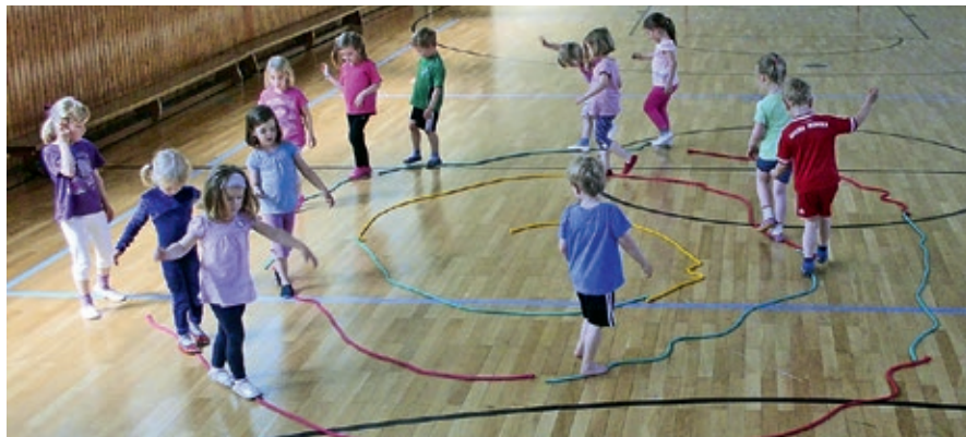
Balancieren auf der Schnecke