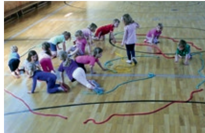
Krabbeln aus der Schnecke